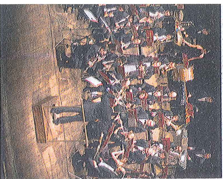
Banda Civica Friati di Padova che aprirà stasera lo spettacolo tifs al centro Marco Paolini nei panni di Galileo, sotto il padovano Bergamasco e Andrea Lo Cicero al termine di Italia-Francia