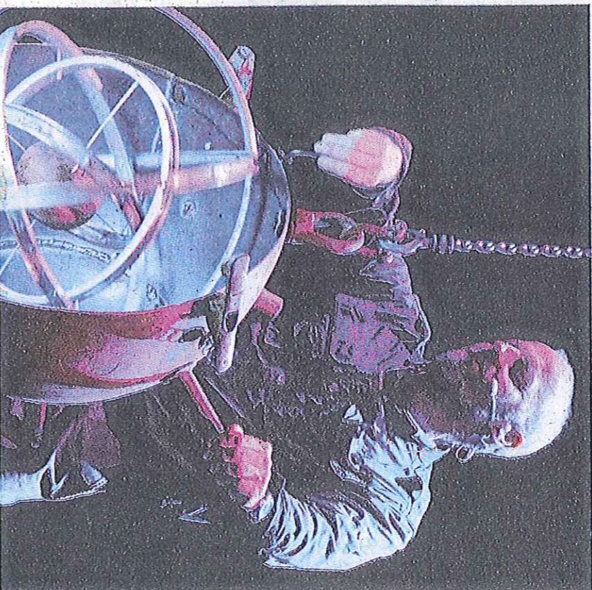
Sotto gli Stare of Shock, in basso il gruppo S. Giuseppe