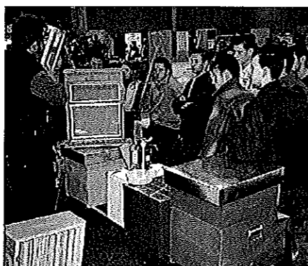
Alla 1ª edizione della fiera di Vita in Campagna, che si svolge dal 18 al 20 marzo presso il Centro Fiera del Garda di Montichiari (Brescia), i visitatori possono incontrare gli esperti dei vari settori

Orario continuato di apertura al pubblico: dalle ore 9 alle 18.