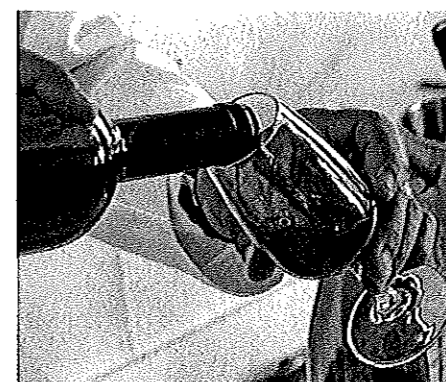
La 45ª edizione del «Vinitaly» è in programma a Verona dal 7 all'11 aprile

È presente alla manifestazione lo stand di Vita in Campagna. Gli abbonati, presentando la «Carta Verde», usufruiscono di uno sconto speciale sul prezzo di copertina di libri, videocassette, DVD e Cd-Rom editi dalle